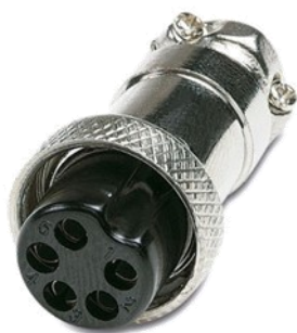
DIM 5 pines hembra