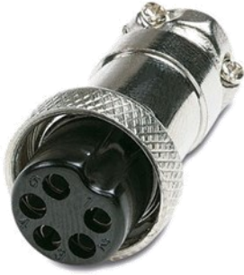
DIM 5 pines hembra